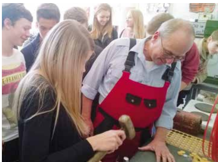
Devátáci si na Dni řemesel zkouší, jak vypadá práce ve strojírenské firmě

Výběr ne zcela vhodné školy nemusí být nutně tragédií. Kdykoli se dá usilovat o změnu, o přestup na jiný typ školy, jiný obor nebo na školu, která je třeba blíže domovu. Vzdělání si navíc můžete doplňovat samostudiem nebo si ho později rozšířit. Stává se, že i absolvent učiliště později vynikal na matematicko-fyzikální fakultě, studentka obchodní akademie patřila k nejlepším na medicíně, student stavební průmyslovky se stal úspěšným právníkem.