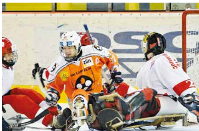
V souboji před branou olomouckých Kohoutů

li se nám, že nám to brzy vrátí na paralympiádě nebo na mistrovství světa. Ale nepodařilo se jim to, vrátili nám to až letos. Éra mezi lety 2007 a 2011, to byly vůbec úžasné roky, kdy se nám všechno dařilo. Měli jsme hodně štěstí, byli