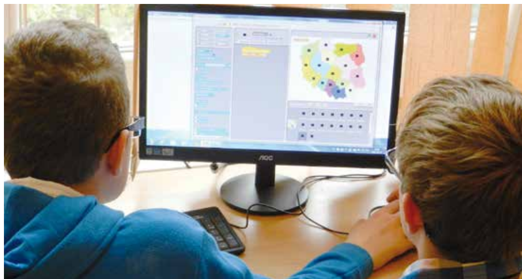
Při výběru školy je dobré respektovat obor, který dítě baví a zajímá se o něj

Pokud má dítě vyhraněný zájem například o techniku, neberte to na lehkou váhu. Studovat to, co ho baví, je pochopitelně snadnější. Pokud syn či dcera nemá zájem o nějaký konkrétní obor, můžete se orientovat podle známek na základní škole. A pokud se hodnocení v jednotlivých předmětech příliš neliší, můžete zkusit gymnázium a získat tak čas, aby si vaše dítě ještě našlo to své pro studium na vyšší nebo vysoké škole.