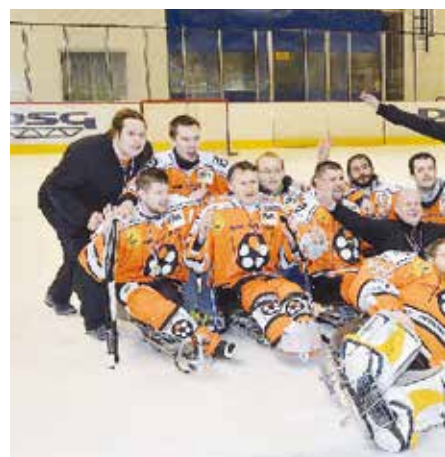
Letošní jaro a oslava druhého ligového titulu