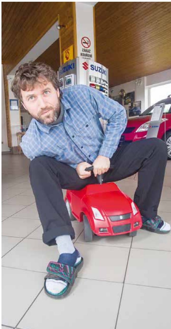
Na nic si nehraju. Jezdím ve stejných autech, jako naši zákazníci. A ty nazouváky? Za ty se nestydím. Procesovaly se mnou celý svět, od Ameriky po Japonsko

Z dětství jsem si přinesl až přehnaný smysl pro soutěživost. Jako dítě jsem jezdil BMX, minikáry a byl jsem zvyklý vyhrávat. V začátcích jsem