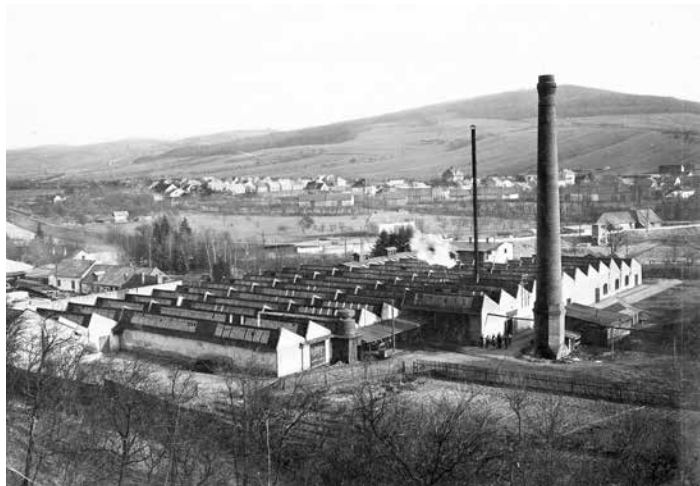
Pohled na Štěpánkovu továrnu. Dnes tu stojí stadion FC Fastav Zlín