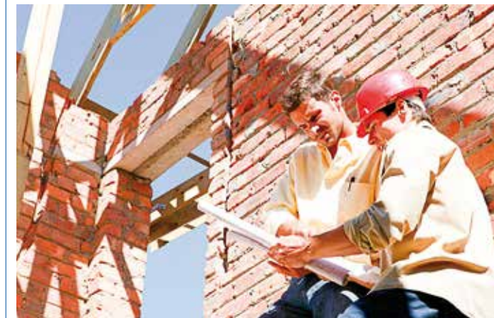
Ohlídejte si stavbu, vyhnete se pozdějším problémům