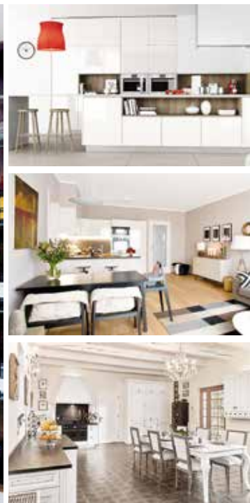
Hanák nábytek

Firma Hanák je známá tím, že často mluví právě o nutnosti vyrábět ze zdravotně nezávadného