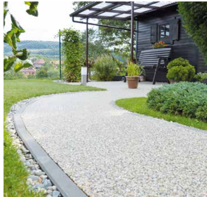
Kamenný koberec na terase a chodníku u chaty na Valašsku

Ve Zlínském kraji máme spoustu realizovaných zakázek. Z poslední doby bych zmínila například kompletní opravu hlavního vstupu Městské nemocnice s poliklinikou v Uherském Brodě. Provedli jsme i řadu rekonstrukcí exteriérů bytových a panelových domů ve Zlíně, vstupní schodiště a rampy u kulturního střediska ve Veselí nad Moravou, ale také třeba chodníky v parku zámekého návrší v Litomyšli. Tam jsme ale náš