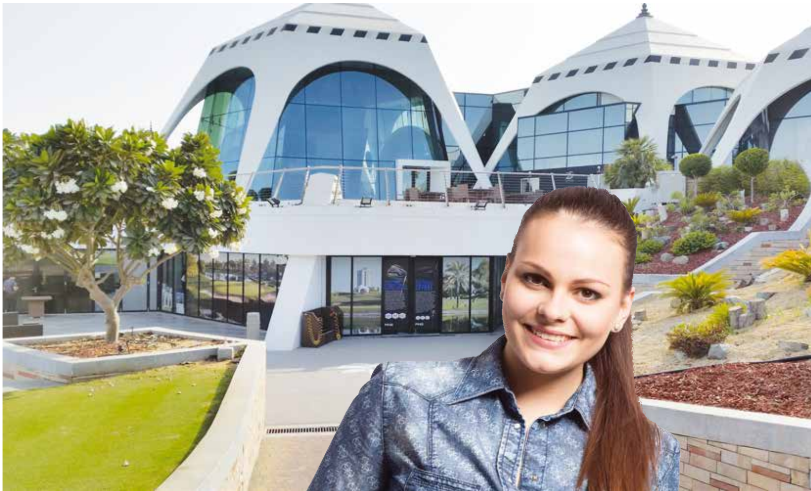
Vstup do Emirates Golf Clubu v Dubaji

systém podle požadavku architektů museli přizpůsobit okolním plochám, takže jsme povrch cestíček přesypali prachem, aby působil jako ostatní mlatové plochy v okolí. Pracujeme také v zahraničí. V loňském roce jsme měli řadu zakázek v Bratislavě, pracovali jsme i v Rakousku, Itálii a dokonce v Dubaji.