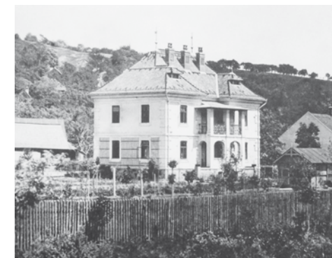
Vila na Cigánově počátkem 20. století. (vlevo), Hasičské rypadlo likviduje bortici se budovu, březen 2016. (uprostřed), Budoucí vzhled Štěpánkovy vily. Vizualizace | A.M.O. projekt (vpravo)