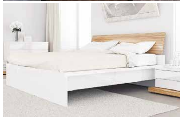
Moderní kuchyně řady Line zasazená do interiéru venkovského sídla. Dole ložnice Elisie

Napadlo vás, že když je například žena na mateřské dovolené s dítětem, anebo jeden z rodičů podniká doma, tak se pravidelně zdržuje v prostoru domu nebo bytu, který je vyjma letních měsíců většinou perfektně hermeticky uzavřen díky plastovým oknům, zateplení? A tak se při vaření nebo i běžném topení vypařují různé látky z nábytku, což není v dlouhodobém měřítku nic příjemného natož zdravého.