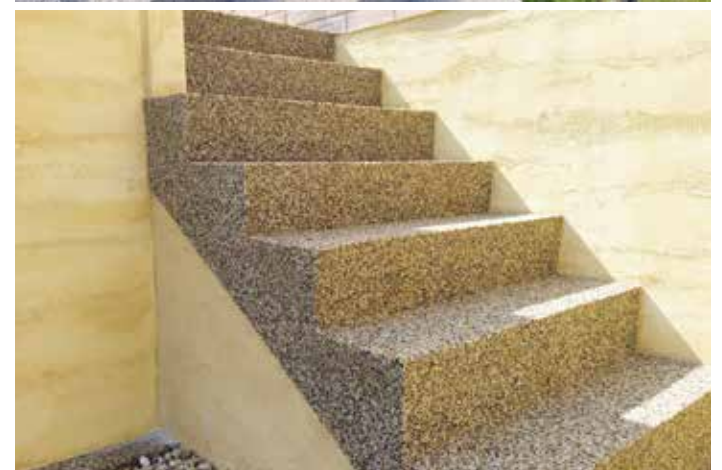
Kamenné koberce FineStone v kombinaci s omítkami FineWall