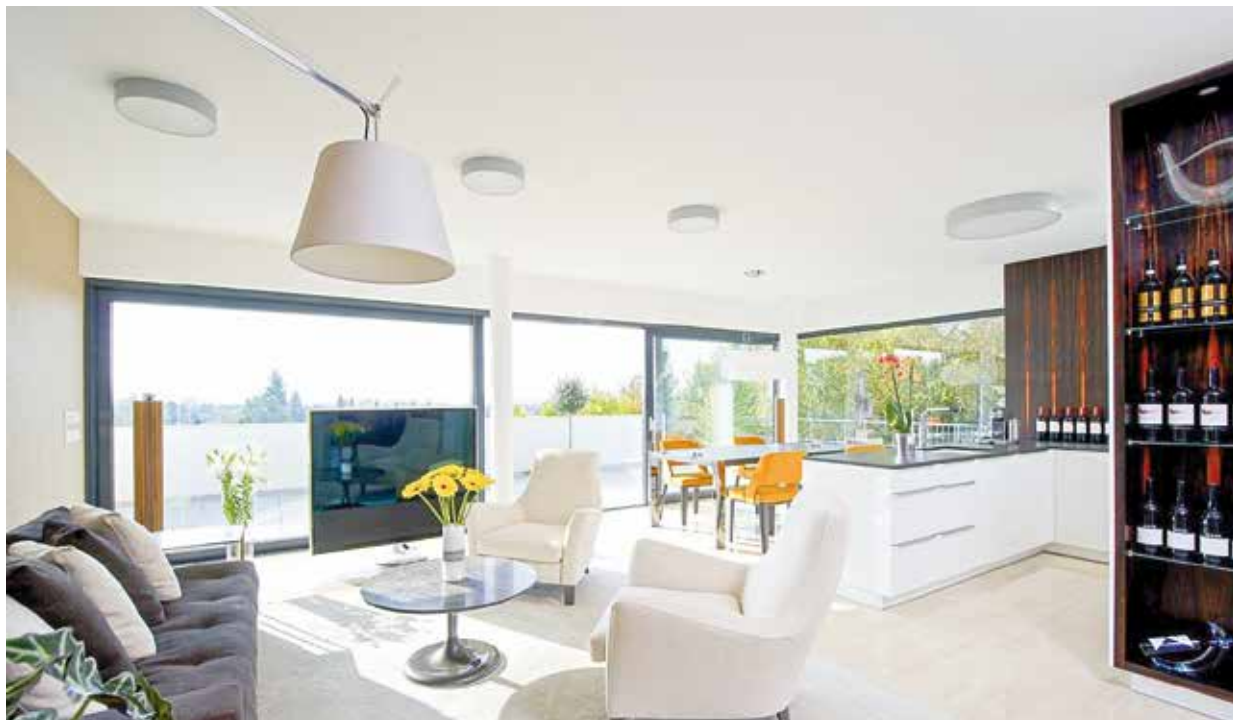
Na velké fotografii ukázka kuchyně řady Hanák Comfort a obývacího pokoje ve stylové vile, nábytek v provedení kmenový makasar a bílý lak. Mezi dalšími realizacemi zaujme rustikální kuchyně Milano s precizní ruční patinou zasazená do zrekonstruovaného mlýna (vpravo dole)

Nejcharakterističtějším produktem, s nímž se firma před lety na trhu prosadila, jsou kuchyně. Běžně prodáváním sortimentem od Hanáka jsou ale i obývací stěny, ložnice, šatny nebo koupelny nábytek. A již zmíněné luxusní interiérové dveře.