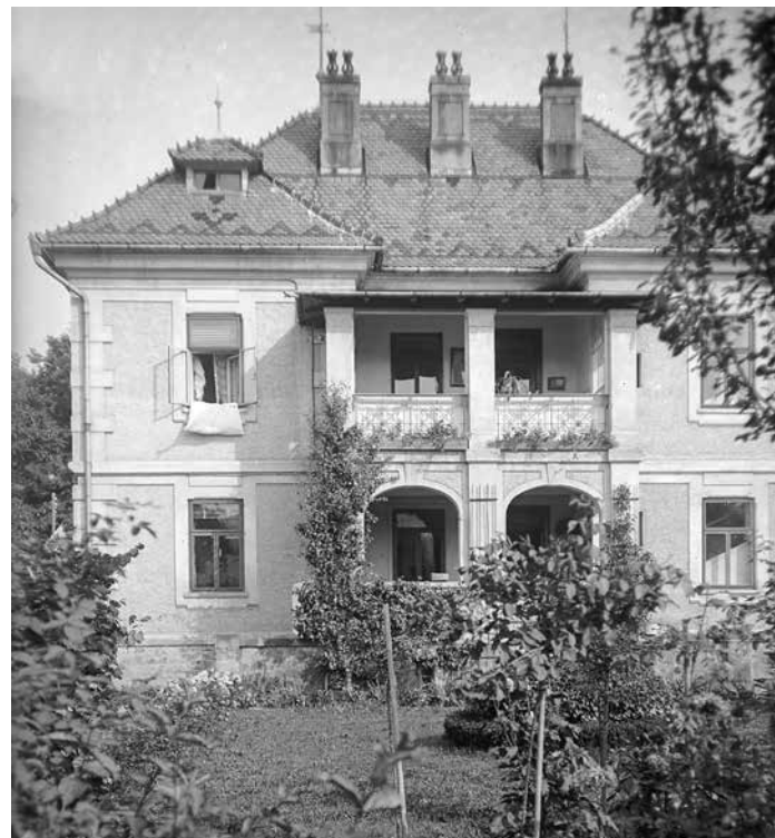
Dům podnikatele Štěpánka býval dominantou Cigánova

V následujících letech přešla vila do vlastnictví úspěšného obuv-