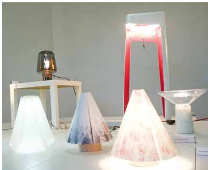
Loňská expozice na zámku představila například designová svítidla

Nejvíce modulů najdete na náměstí. Nebudou scházet prezentace značek Tescoma, Blackcomb, cz či Janošik. Sklářské odvětví za-