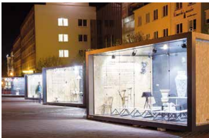
Zajímavé designérské počiny budou k vidění v osvětlených modulech na náměstí