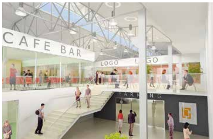
Mezi budovami 13A a 12 se v létě otevře nové nákupní molo

Nejprve vznikl nápad udělat Kavárnu Továrna. Příjemné místo, kam se lidé rádi vrací posedět s přáteli i za kulturou. Pak to byla plzeňská restaurace PUOR, ve Zlíně totiž chyběla tanková Plzeň a lidé za ní jezdili až do Olomouce. Otevřela se i bezlepková prodejna, do které se sjíždějí lidé z dalekého okolí. My jako majitelé objektu tady máme je-