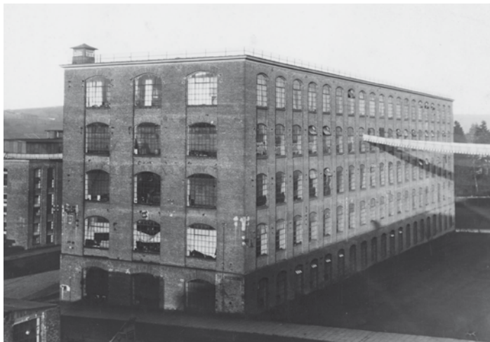
V baťovském areálu se původně tovární budovy číslovaly od nádraží. Dnešní 13 měla číslo 4. Na snímku z let 1926 až 1927 je dobře patrné obloukové ukončení oken.

Je málo krajských měst, které mají fabriku v centru města, navíc tak velký brownfield. Navíc mám přímo ke 13. budově blízký vztah. Oba má rodiče celý život pracovali ve Svitlu a seznámili se tady. Otec byl elektrikářem v budově číslo 14 a maminka pracovala jako svrškařka kožené obuvi v budově 23. A přesně mezi nimi je budova 13. Říká se, že třináctka je nešťastné číslo, ale kdyby se tehdy má rodiče u 13. budovy nepotkali, nebyl bych na světě. Když jsem budovu v roce 2005 koupil a ukázal ji rodičům, maminka mi řekla: „Co blázníš, ty kluku, vždyť komunisté ti to zase seberou, až splatíš všechny ty úvěry.“