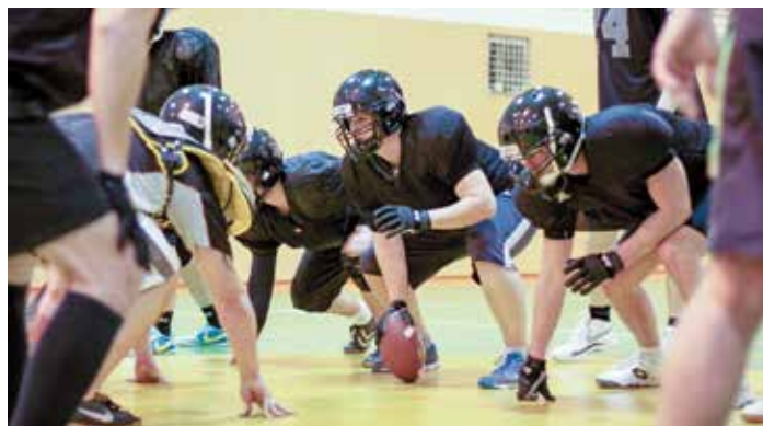
Zlínský Golemové při tréninku

Od příštího akademického roku 2016/17 tak studenti univerzity najdou tento u nás netradiční sport v nabídce sportovních aktivit, které si volí v rámci tělocviku. Dobrovolně se však k týmu mohou připojit již nyní. Zájemci o americký