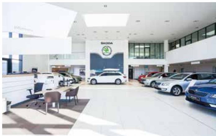
Nový autosalon značky Škoda v Olomouci

lo neustálého růstu. Tento proces byl zastaven a nastal až čtvrtinový propad produkce v období krizových let. S tím souviselo propouštění zaměstnanců a došlo k výraznému omezení v přípravě mladé generace. I přes krizová léta se nám dařilo oslovovat zákazníky a dosahovat růstu tržeb a zvyšování zaměstnanosti.