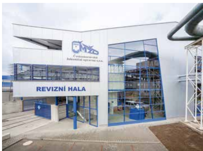
Železniční depo a montážní hala pro opravy lokomotiv a vagonů v Přerově

Stavebnictví se po revoluci výrazně podílelo na změnách vzhledu měst a obcí, občanské vybavenosti, průmyslových staveb a dopravní infrastruktury. Zaměstnávalo zhruba 450 000 zaměstnanců a dosahova-