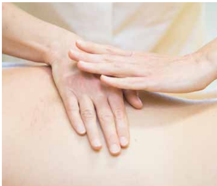
V ambulanci probíhají ruční i přístrojové masáže nemocných s lymfatickými otoky, ale také masáže sportovní a rehabilitační