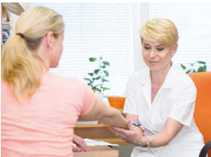
Lymfatickými otoky končetin trpí mnoho žen po karcinomu prsu

Kromě komplexní péče o pacienty s lymfatickými otoky se zabýváme i léčbou celého spektra kožních onemocnění jako je léčba akné, atopického ekzému, lupénky, bércových vředů, plísňových onemocnění kůže, nehtů i vlasů, vyšetřováním znamének. Nabízíme také zákroky kosmetické, které již nejsou hrazeny ze zdravotního pojištění, mezi něž patří manuální nebo přístrojové lymfomasáže, napomáhající řešit celulitidu, tvarovat a formovat postavu, a zákroky k omlazení pleti, redukci vrásek, navození novotvorby kolagenu, chemický peeling. Provádíme i odstranění drobných výrůstků, bradavic či keratóz.