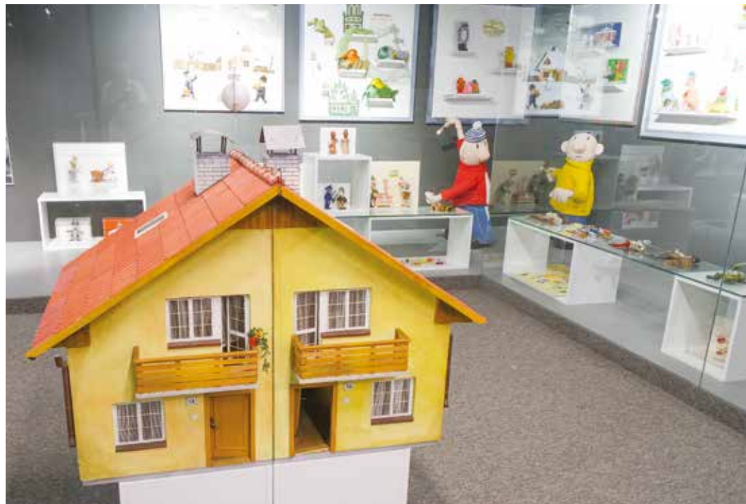
Kabinet filmové historie - postavičky z večerníčku Pat a Mat, v popředí jejich domek

Další podlaží nabízí různé krátkodobější expozice, tvůrčí dílny pro veřejnost i profesionální zázemí pro výrobu animovaných filmů. Již nyní zde vzniká nová série večerníčků O prasátku Lojzíkovi