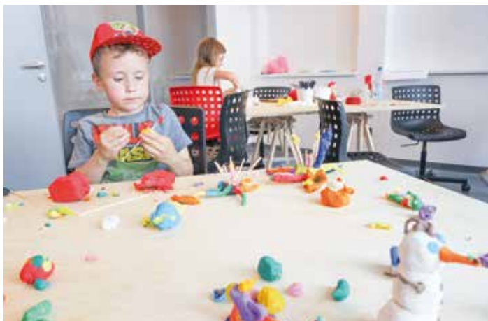
Filmový uzел - v animačních dílnách si děti mohou vytvořit figurky z modelíny a pak je rozpoehybovat v kratičkém filmu

Program vzniká ve spolupráci s multikinem Golden Apple Cinema. Od čtvrtka do neděle zde chtějí nabízet převážně premiérové a nové tituly za ceny od 99 do 139 korun. Víkendová odpoledne budou navíc rozšířena o rodinné filmy včetně starších pohádek pro děti za zvýhodněné vstupné 69 korun. V budoucnu plánují rozšíření programu o artové snímky, dokumentární filmy nebo záznamy koncertů. (red)