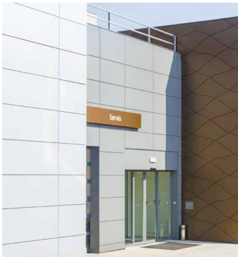
Autosalon Hyundai na třídě Tomáše Bati ve Zlíně má unikátně řešenou podobu opláštění

Ano, máme mezi sebou zaměstnance, kteří jsou u firmy zaměstnáni celých dvacet let, a samozřejmě budeme slavit i se stávajícími zaměst-