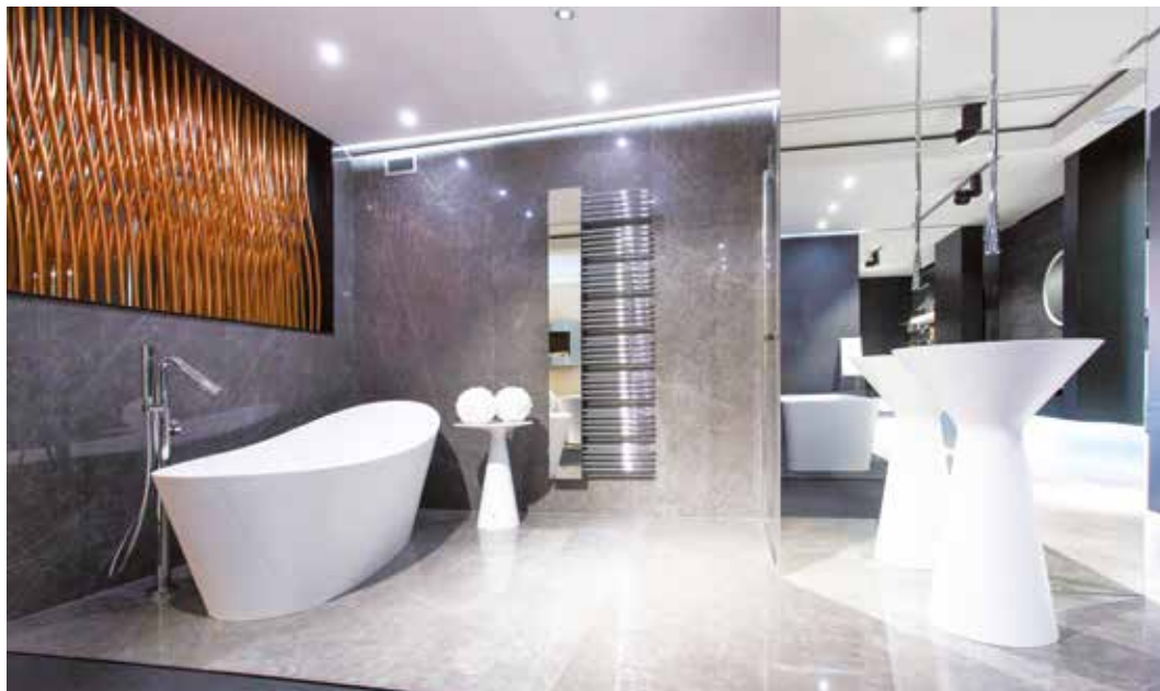
Stále oblíbenější je sanitární zařízení z přírodních litých materiálů, často v netradičním moderním designu

Dvacet let fungujeme především na principu spolupráce s montážními firmami, které k nám posílají své zákazníky. Nyní