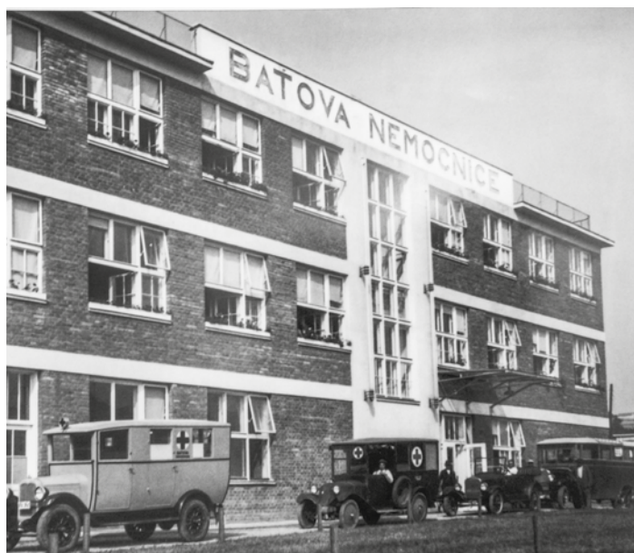
Vstupní budova nemocnice kolem roku 1930

Dnes Krajská nemocnice Tomáše Baťi zaměstnává přes dva tisíce lidí, z toho je asi 300 lékařů. K dispozici je zde přes tisíc lůžek, na kterých je ročně hospitalizováno přes 40 tisíc pacientů.