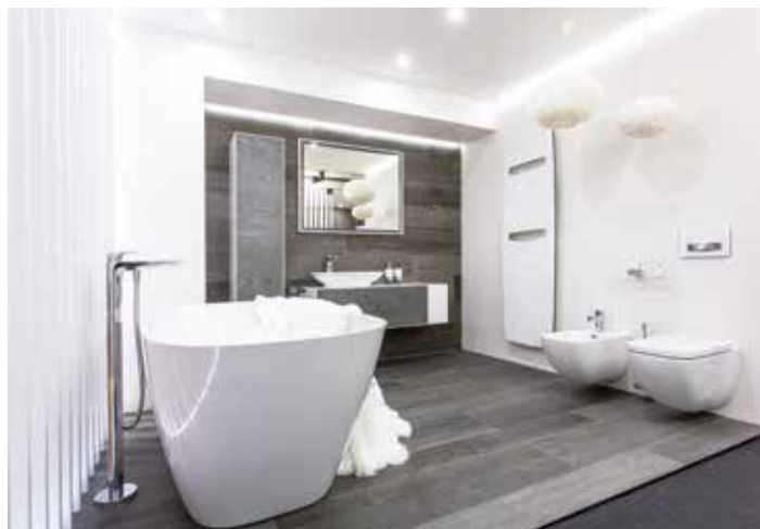
Koupelnám dnes dominují nadčasová šedá a bílá barva