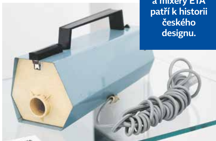
Výstava spotřebičů ETA návštěvníka naladí na retro vlnu

„Jsou to desítky let společné práce konstruktérů, designérů, technologů i propagačních výtvarníků. Především ale desítky a desítky typů vysavačů, žehliček, kuchyňských strojů, vařičů, grilů a dalších druhů spotřebičů, které se natrvalo