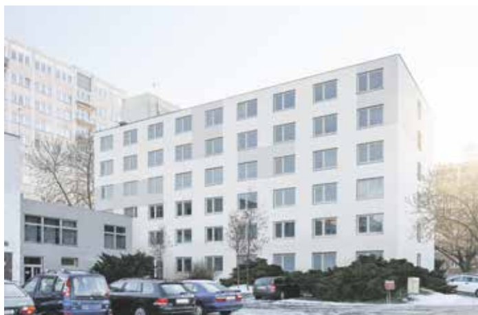
Někdejší hotel Sole získá novou fasádu i moderní interiér. Bude zde 85 garsonek, případně i kanceláře.