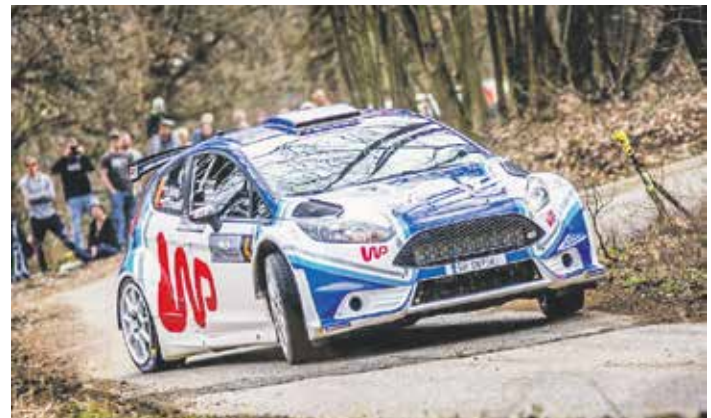
Populární rallysprint na Kopné se pojede popětadvacáté

„Pojedeme opět tři úseky rychlostních testů, a to Zádveřice, Kameňák a Kopná. Vycházíme z loňského osvědčeného formátu. U tradičního úseku Kopná je novinkou v závěru rychlostní zkoušky divácká zóna s názvem Partr aréna na rozlehlé ploše u bývalých tenisových kurtů ve Všemíně. Po prudkém odbočení