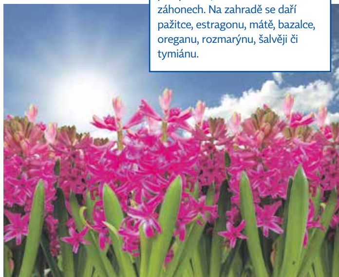
Ozdobou jarních zahrad jsou i fialové nebo růžové hyacinty

Na záhonech, kde už roztál sníh, hned začíná klíčit plevel.