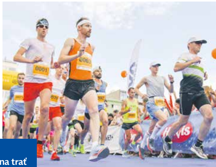
Účastníci Festivalového půlmaratonu probíhající přes náměstí Míru

Zájemci o účast v závodech mohou využít možnosti registrace za nejvýhodnějších podmínek, které platí už jen do konce března. V tomto období zaplatí nejlevnější startovné ve výši 599 Kč za půlmaraton, 499 Kč za čtvrtmaraton a 1 999 Kč za čtyřčlennou štafetu. V ceně je například batůžek, kvalitní funkční tričko, vstup na večerní koncert v koncertní zóně, pamětní medaile, pitný režim na