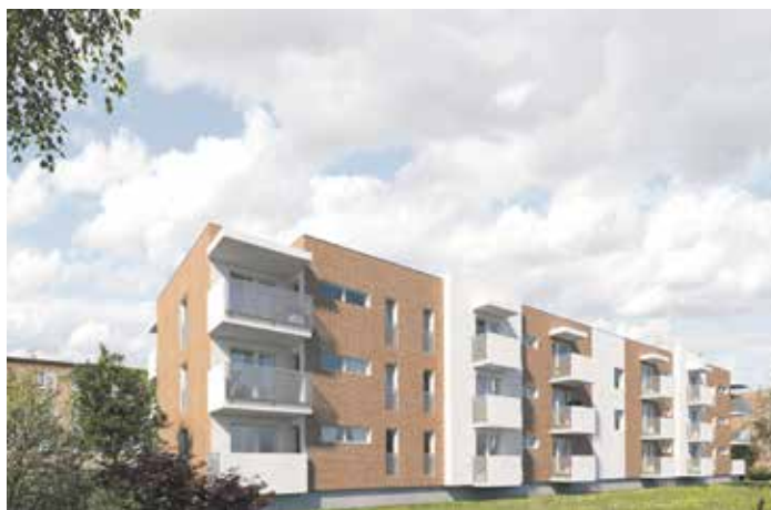
Nový bytový dům na Zálešné vyroste na místě bývalé prádelny. Jeho vzhled respektuje okolní baťovskou zástavbu.

Petr Vašíčko: Mám zde rodinu a vracím se sem proto pravidelně nejen kvůli obchodu. Chci zde něco