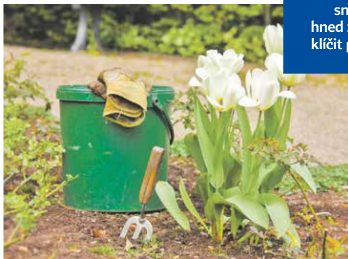
Na jaře je třeba chopit se nářadí a dát se do práce

Na jaře také věnujte velkou pozornost růžím. Koncem března odstraňte zimní ochranu a pokud už nehrozí silné mrazy, tak růže prořežte. U popínavých stačí, když odstraníte nezdravé nebo poničené větve. V březnu můžete zasadit i nové růže, půda by ale měla být zcela rozmrzlá. Růže zasadte na záhon, který je dostatečně slunný a vzdušný.