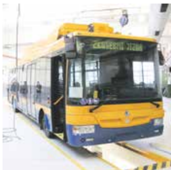
Čtyřdveřový trolejbus SOR 30 Tr, který bude jezdit na lince k zoologické zahradě

Městskou hromadnou dopravu ve Zlíně čeká změna. Do zlínských částí Štípa a Kostelec budou od začátku dubna zajíždět trolejbusy s alternativním bateriovým pohonem, budou to linky číslo 4 a 5. U zoologické zahrady Lešná pak bude zajištěn pro obyvatele Velíkové přestup na novou autobusovou linku číslo 46.