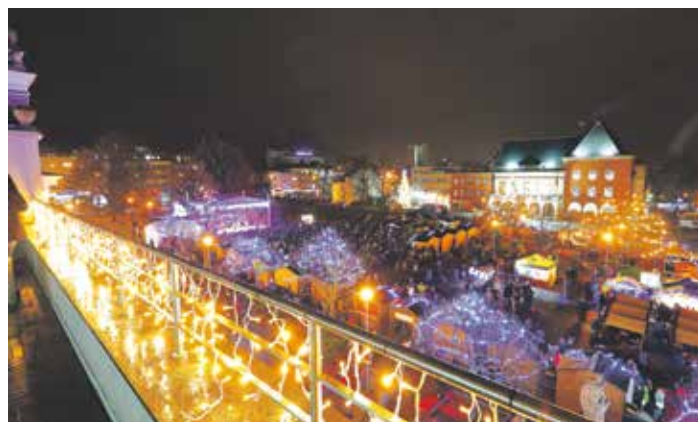
Adventní Zlín 2021. V jaké podobě se asi uskuteční?

Následující dny od rozsvícení stromu již Adventní Zlín 2021 poběží na plné obrátky. Těšit se můžete na koncerty známých interpretů, jako je například Event Jazz, Děda Mládek Illegal Band, Adam Ďurica, Kateřina Marie Tichá s kapelou Bandjeez, ADD Gospel Přerov nebo třeba Avion Big Band Zlín. A to rozhodně nejde o vyčerpávající výčet. Kulturní program, který je každoročně bohatý pro celou rodinu, je i letos doprovázen programem doprovodným, kde se budou moci vydovářet a realizovat hlavně ti nejmenší. Nebudou tak chybět vánoční tvořivé dílničky, dětské