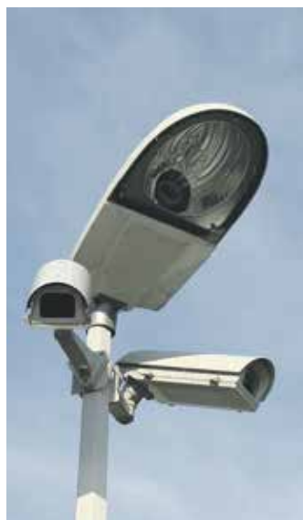
Kamery by měly zabránit i nešvarům, jako je projíždění na červenou Ilustrační foto

Nové technologie, které jsou součástí chystaného systému, by také mohly utnout nešvar mnoha řidičů, kterým je projíždění na červenou. To by kamery dokázaly zaznamenávat automaticky.