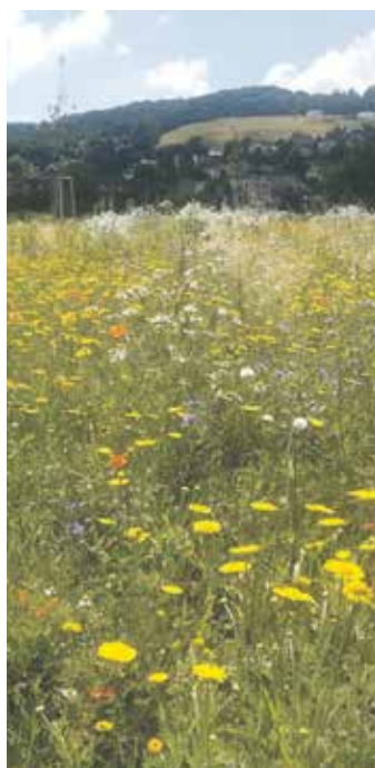
Pro louku na Bartošově čtvrti bývá typická bujná květena

Příluky a cyklostezku kolem Dřevnice, kolem které stojí i řada laviček na posezení, si řada lidí spojuje s klidnou lokalitou, kam je příhodno zamířit, pokud si člověk chce odpočinout, nikam nespíchat a třeba se jen tak procházet kolem řeky a sledovat její