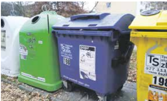
Nádobu na papír najdete zpravidla v sousedství její žluté kolegyně

Jak se papír recykluje? A jaké nachází další využití? Některé odpovědi se nabízí již v samotné otázce. Papír vytríděný do příslušných odpadových nádob se dotřídí dle typu na papír, noviny, karton a ostatní a ve slisovaném