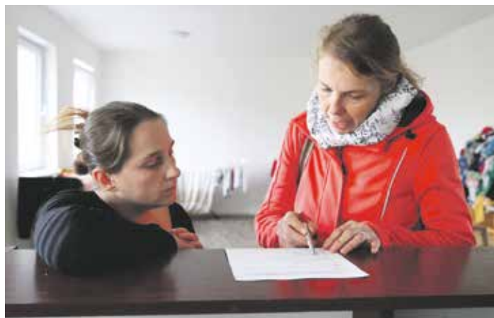
Nabídka oddlužení platí do 28. ledna 2022

„Milostivé léto vítáme. Na legislativních změnách jako nezisková organizace pracující s chudými rodinami, které se dostaly do dluhových pastí, dlouhodobě aktivně spolupracujeme a podporujeme je. Věřím,