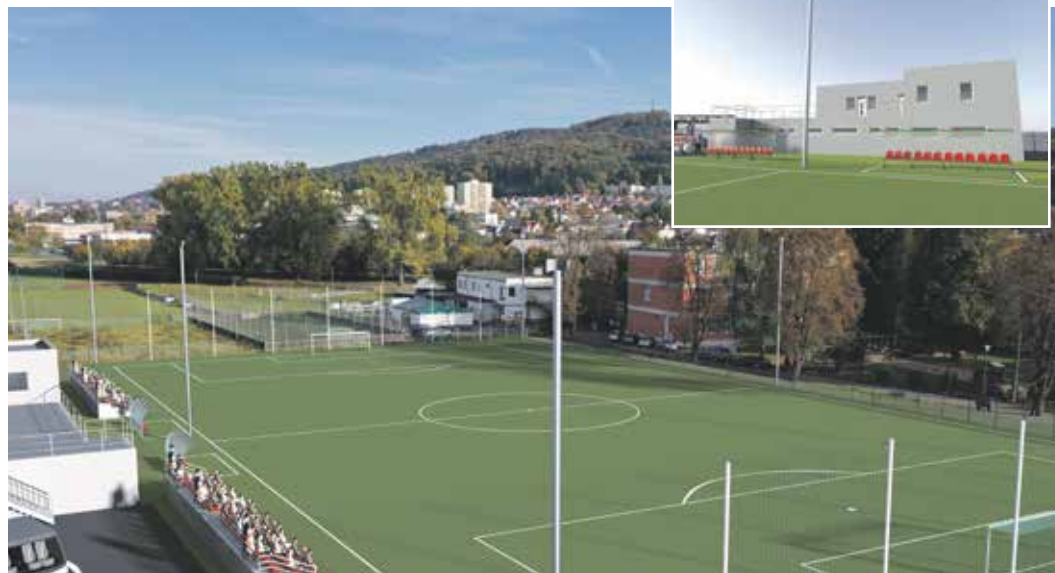
Vizualizace nového hřiště SK Louky a správní budovy

Výstavba hřiště vyžaduje předběžné práce a místní obyvatelé zde již v roce 2017 mohli zaregistrovat čilý pracovní ruch – to když