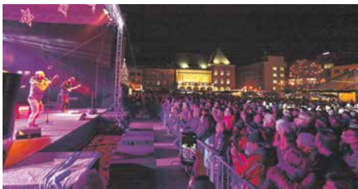
Letošní novinkou jsou koncerty revivalových kapel

Vzhledem k měnícím se protiepidemickým opatřením sledujte web města pro aktuální informace