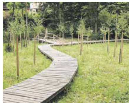
Kolem rybníku vede naučná stezka s informačními tabulemi.