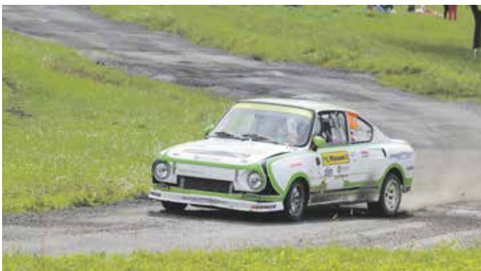
Star Rally Historic přitahuje diváky všech věkových kategorií.

V doprovodném programu barumky ani tentokrát nechybí populární Star Rally Historic, která pravidelně přitahuje mnoho fanoušků nejen motoristické minulosti. Letošní patnáctý ročník měří celkem 596 kilometrů a obsahuje jedenáct rychlostních zkoušek v celkové délce 157 kilometrů. Bližší informace naleznete na webu czechrally.com nebo na sociálních sítích Facebook, Instagram nebo Twitter.