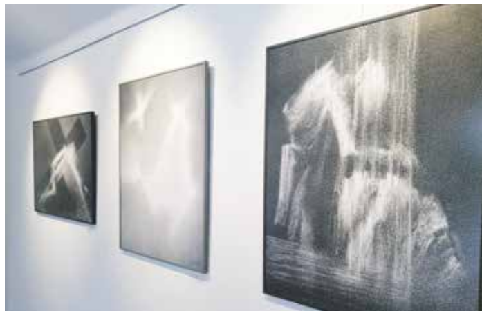
Vyznění kresby se mění dle vzdálenosti od obrazu i úhlu pohledu.

Junovy kresby, kde i ten nejmenší detail má podobně jako v hudbě svůj jasně daný řád, autorovi vynesly řadu cen. V letech 1998 až 2010 se mu dostalo největšího a opakovaného ocenění na Středoevropském a později