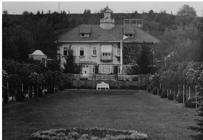
Vila Tomáše Bati se svého času honosila luxusní zahradou.

Ani okolí vily nezůstalo beze změn. Ve dvacátých letech se na