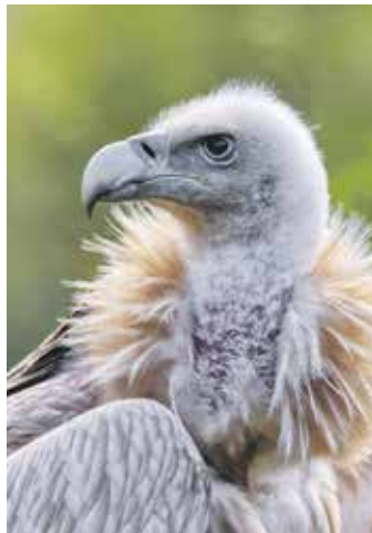
Voliéra umožňuje supům volný „výběh“.

„Návštěvníci se budou moci třikrát týdně posadit ve velkém amfiteátru, který je součástí voliéry, a na jevišti před ním sledovat, jak si dvě desítky supů poradí s připraveným kadáverem celého jatečného zvířete. Všechno se přitom bude odehrávat jako ve volné přírodě, kdy se supi o získanou