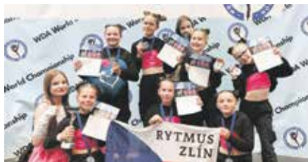
Malé tanečnice výrazně zabodovaly na MS v Budapešti.

Nábor do nových kurzů se uskuteční 12. září od 16 hodin v prostorách ZŠ Komenského II. Podrobnější informace získáte na webu rytmuszlin.cz nebo na tel. 777 082 878.