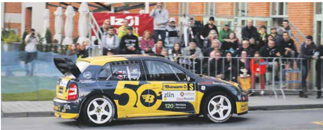
Tradiční městská erzeta se uskuteční v pátek od 21 hodin.

Téměř 760 kilometrů a 13 rychlostních zkoušek v celkové délce 200,43 km na sedmi úsecích s asfaltovým povrchem. Právě tolik nabízí letošní dvaapadesátý ročník Barum Czech Rally Zlín, který už doslova klepe na dveře. Jedna z největších motoristických událostí v republice se uskuteční o týden dříve než je zvykem, závodníci vyrazí na trasu již ve dnech 18. až 20. srpna. A fanoušci motoristického sportu se opět mají na co těšit.