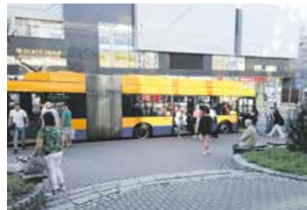
Za zvýšení cen může růst provozních nákladů.

K celé řadě změn dojde od 1. září v cenách jízdného Dopravní společnosti Zlín-Otrokovice. K nejzásadnějším novinkám patří zvýšení ceny základní jízdenky na 18 korun, která se nově má stát přestupní a platnou po 30 minut. Změny se však mají dotknout všech cestujících. Sleva na Junior pas se například zatím týkala pouze školáků, nyní na něj budou mít nárok i děti ve věku od šesti let až do zahájení školní docházky. Úplnou novinkou je pak zavedení Junior pasu Student, určeného pro studující ve věku do 26 let, nebo Mateřský pas určený pro rodiče, kteří od státu pobírají rodičovský příspěvek. Dopravní podnik od 1. září rovněž nabízí S-pas seniorům ve věku od 65 let (tedy nikoliv až od 70 let) a pořídit si jej budou moci i invalidé 3. stupně. Seniori navíc už nebudou muset