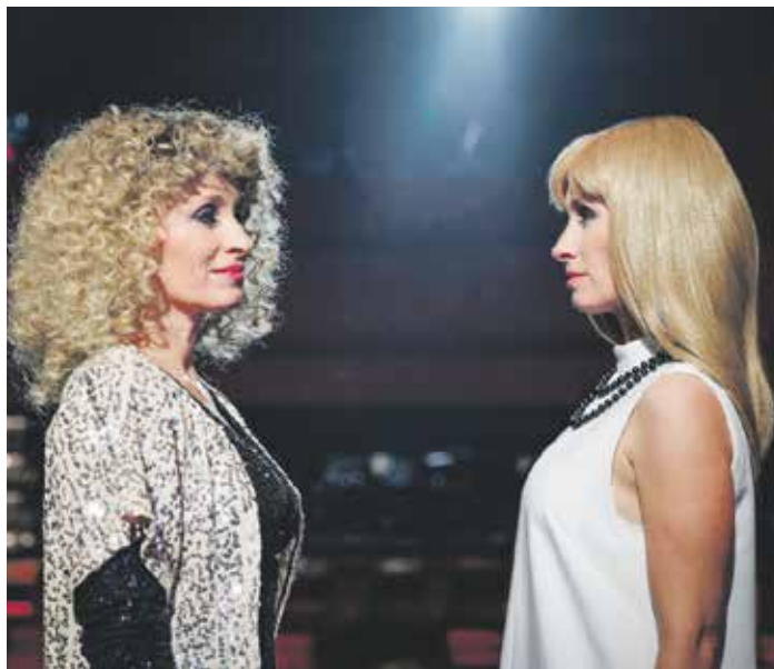
Premiéra je současně připomínkou pátého výročí úmrtí Evy Pilarové.