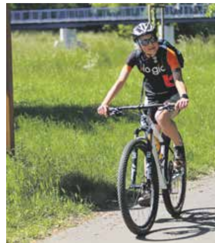
Květnová výzva se letos uskuteční podzváněcí.