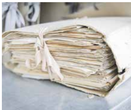
Vedle knihy se připravuje také tematická výstava.

„Vzhledem k propojenosti firmy Baťa se zlínskou nemocnicí a obyvateli Zlína bychom rádi požádali veřejnost o pomoc. Pokud by někdo měl doma archivní fotografie, týkající se nemocnice, nebo jakékoliv dokumenty, moc by se nám hodily do knížky, ale i na web či na výstavu. Třeba se najdou také nějaké staré přístroje, vybavení či historické artefakty, ty také velmi uvítáme,“ uvedla