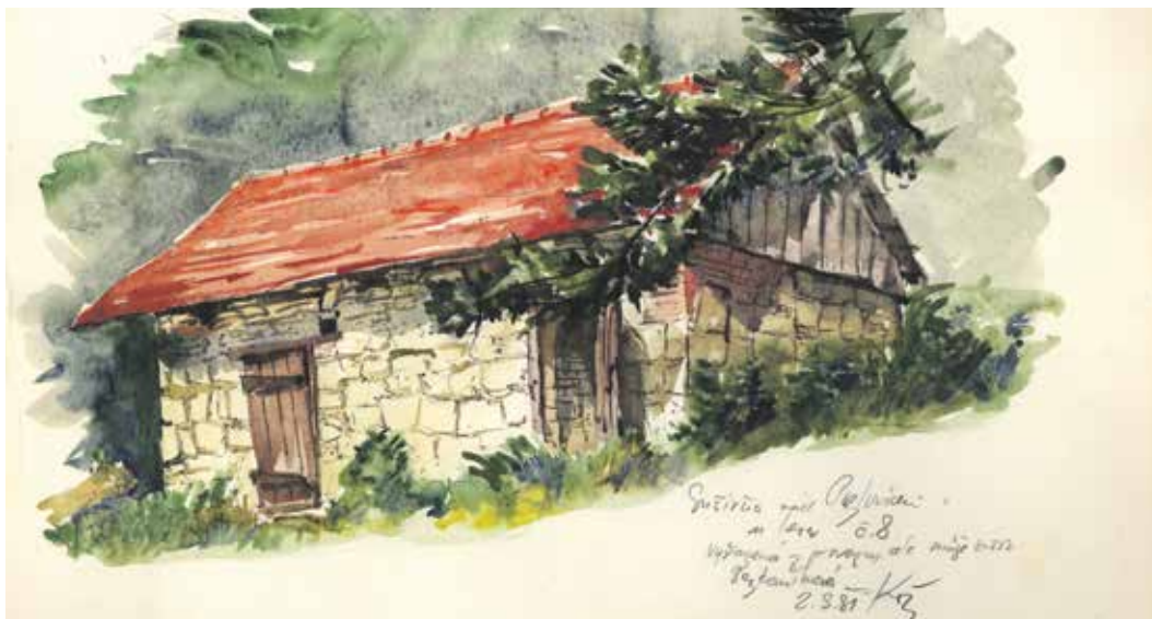
Kresba sušírny nad Pozlovicemi z roku 1981.

Odborník na problematiku konstrukcí montovaných budov a nové typy jejich krytin z pryžových a PVC fólií, specialista v oblasti střeleckého výcviku tankových vosk, ale také dokumentarista lidové architektury a lidového oděvu moravského Slovácka. Tato až neuvěřitelná profesní různorodost je jedním z charakteristických rysů etnologa Jaroslava Koželuha (1926–2015), od jehož úmrtí letos v únoru uplynulo deset let. Pouhé tři roky pak uplynuly od výstavy, kterou Muzeum jihovýchodní Moravy ve Zlíně připomenulo odkaz této regionální osobnosti.