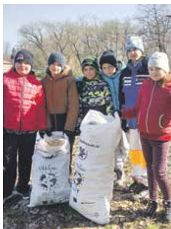
Kampaň se každoročně účastní tisíce dobrovolníků.

Možnosti, jak získat bezplatnou podporu od ochránců