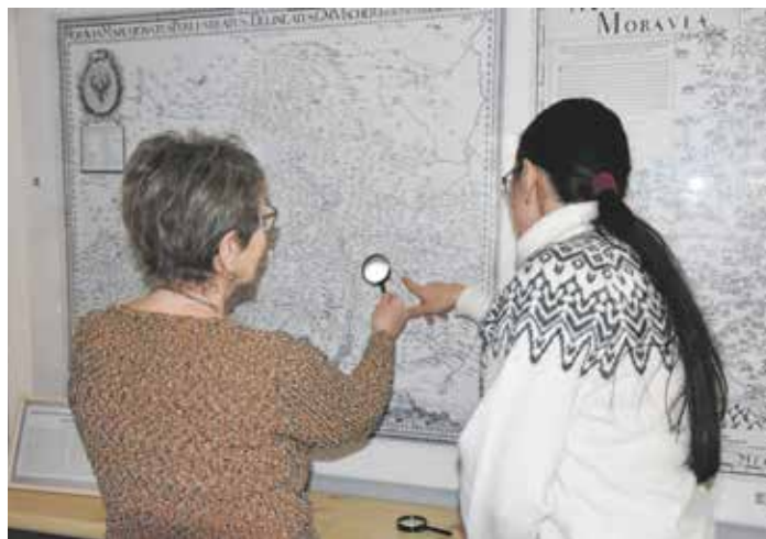
Na výstavě je k vidění i unikátní Vischerova mapa Moravy.

Kromě této výstavy muzeum nabízí svou stálou kartografickou expozici, na které je postaven