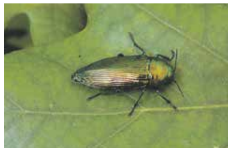
Vzácný brouk má vhodné zázemí pro život i ve zlínské zoo. Ilustrační foto

Víte, který druh hmyzu patří v České republice mezi nejkrásnější a nejhroženější? Je to zhruba dva centimetry velký kovově lesklý brouk, který ke svému životu potřebuje volně rostoucí osluněné duby. Odvíjí se od toho i jeho pojmenování – krasce dubový. U nás žije na několika místech na jižní Moravě a v jižních Čechách, a aby z naší přírody nezmizel úplně, spustilo Ministerstvo životního prostředí již v roce 2022 program na jeho záchranu. Ten spočívá v ochraně starých dubů nebo instalaci soch, jež budou vyřezány z dubu letního. Protože ty se nacházejí i v areálu zlínské zoo, uskutečnil se zde v září minulého roku monitoring výskytu krasce dubového. A i když zatím nebyla přítomnost brouka prokázána, jeho výskyt naznačily