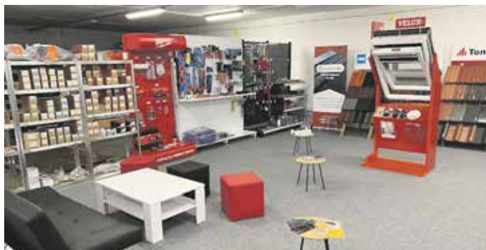
Everest se zabývá komplexním řešením střeche, čemuž odpovídají skladové zásoby.

„V Everestu se zabýváme komplexním řešením střeche, ať už jde o ploché, nebo šikmé střechy. S tím souvisí i naše skladové zásoby, mezi kterými najdete dvoumetrové trapézové tabule pro jednoduchý přístřešek nebo materiál k pokrytí střechy rodinného domu. Samozřejmě včetně všech doplňků, které se střešními realizacemi souvisí,“ uvádí Miroslav Lebánek, jeden ze zakladatelů firmy. Kromě toho že si mohou řemeslníci i zájemci