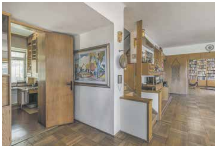
Největším lákadlem bývají komentované prohlídky vily.

„Dalšími zajímavostmi bude výstava přímo v prostorách vily, která přehledně představí, co vše vila od svého otevření v roce 2022