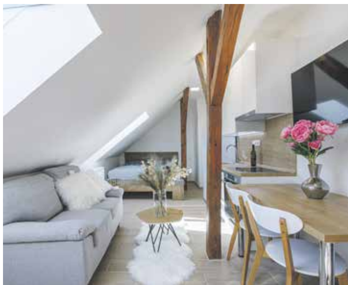
G2 Reality připravuje byty podle vlastního standardu.

Další službou, kterou je schopna G2 Reality zajistit, je kompletní správa nemovitosti. „To znamená, že nám klient poskytne volnou ruku při správě jeho bytu či domu, který je určen