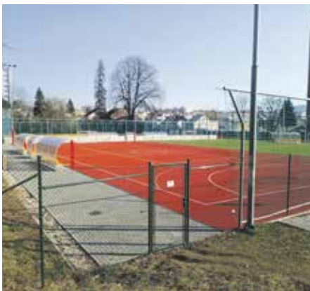
Hřiště lze využívat od 8 do 20 hodin.

„Hřiště u Sokolovny je neodmyslitelnou součástí Zlína a již dlouho si o kompletní obnovu říkalo. Víceúčelový areál je nyní vybaven hřištěm s umělou trávou pro fotbalové aktivity a hřištěm s umělým povrchem pro ostatní míčové hry. Návštěvníci kromě toho mají k dispozici umělé osvětlení a zázemí se šantami, sprchami a sociálním zařízením, které zajišťuje maximální komfort,“ uvádí Jana Bazelová, náměstkyně primátora pro oblast mládeže, tělovýchovy a sportu.