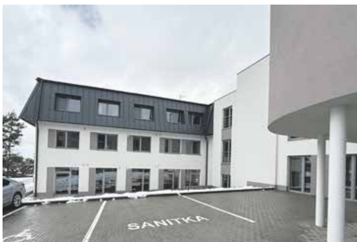
Do konce dubna má být objekt znovu plně obsazen klienty.

Objekt sociálních služeb v Malenovicích znovu ožil. Po kompletní, rok a půl trvající rekonstrukci tří budov vzájemně propojených spojovacím krčkem zde vznikl nový domov se zvláštním režimem. Město jej už předalo poskytovateli sociálních služeb Naději, která zde bude provozovat Dům pokojného stáří Naděje