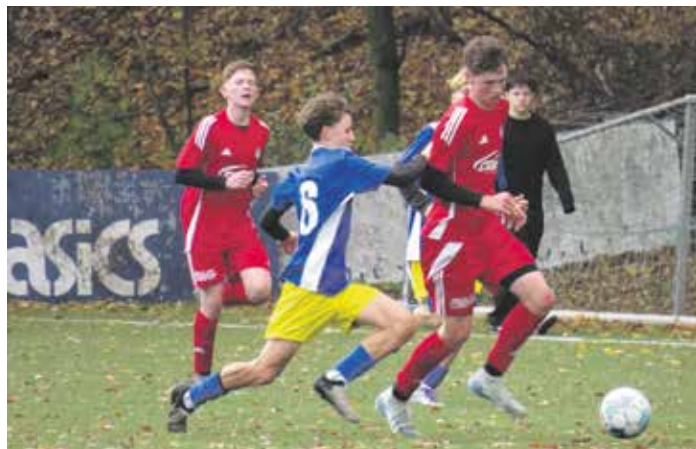
Férový přístup a dobrý tým – faktory, které dokáží hráče v klubu udržet.

Během letošní sezony se počítá s účastí klubu na turnaji o pohár hejtmána a turnaji o pohár primátora, v plánu je pokračovat se čtyřvikendovým turnajem Winter Cup, který organizují kluboví trenéři, a letos bude také poprvé realizován týdenní fotbalový příměstský tábor. „Vedle toho jsme hrdým partnerem turnajové soutěže MiniMorava, počítám tedy, že minimálně dva turnaje se odehrají u nás. A abych nezapomněl, v rámci dobrých vztahů s klubem Viktoria Žižkov plánujeme výlet pro naše děti do Prahy,“ vypočítává předseda klubu.