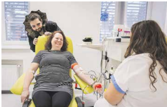
Prvodárci mohou přijít i bez objednání.

Podle údajů přišlo v roce 2024 darovat celkem 11 356 dárců, v roce 2025 pak o 920 méně. Největší propad však nastal