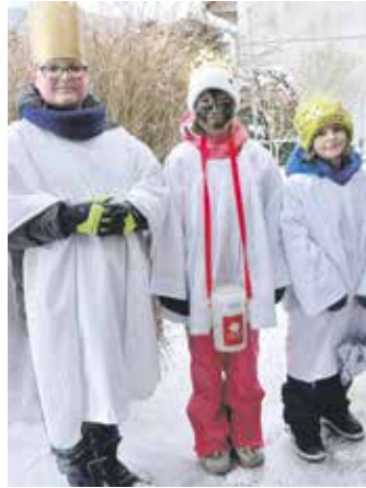
Do pokladniček se podařilo nashromáždit přes 120 kg mincí a 2 216 metrů bankovek.

Při přepočítávání výnosu sbírky i letos budilo zájem, co všechno se v kasičkách ukrývalo. „Z kuriozit šlo letos pouze o jeden obal od lízátků a účtenku pečlivě zabalenou v bankovce. Když zmiňují bankovky, tak se objevilo několik již neplatných s úzkým stříbřitým proužkem a pár mincí, které by možná ani v bance neidentifikovali, co se země původu týče. Především však kasičky obsahovaly 31 782 použitelných platidel, tedy více než 2 216 metrů bankovek