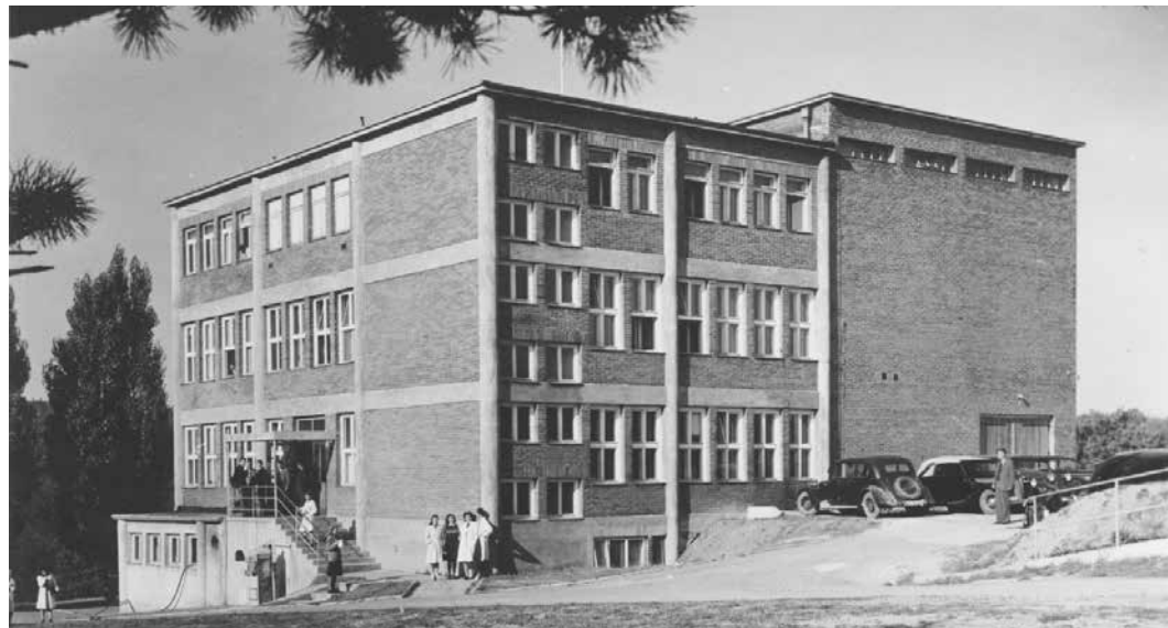
Filmové ateliéry oslaví v létě 90 let od svého založení.

Zlínské filmové ateliéry během války začaly navzdory tehdejší situaci růst. Do města se vraceli filmaři z Prahy, kde byla produkce omezena, a přicházeli i tvůrci, kteří se ocitli v ohrožení – ať už ze strany gestapa, nebo kvůli hrozbě totálního nasazení. Řadu mladých talentů přilákalo například