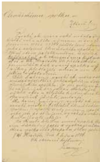
Ukázka protokolu z ustavující schůze Čtenářského spolku.

Za důležitý krok lze považovat rozhodnutí městského zastupitelstva z 11. března 1886, kdy byla do správy Čtenářského spolku předána obecní knihovna. Její fond se měl stát základem spolkové knihovny, která se úspěšně rozrůstala počtem evidovaných svazků i počtem čtenářů. Na přelomu století se v ní nacházely již stovky svazků, zatímco počet výpůjček šel do tisíců. V roce 1905 byla tato knihovna oficiálně povýšena na veřejnou knihovnu a její chod finančně podporovalo i město.